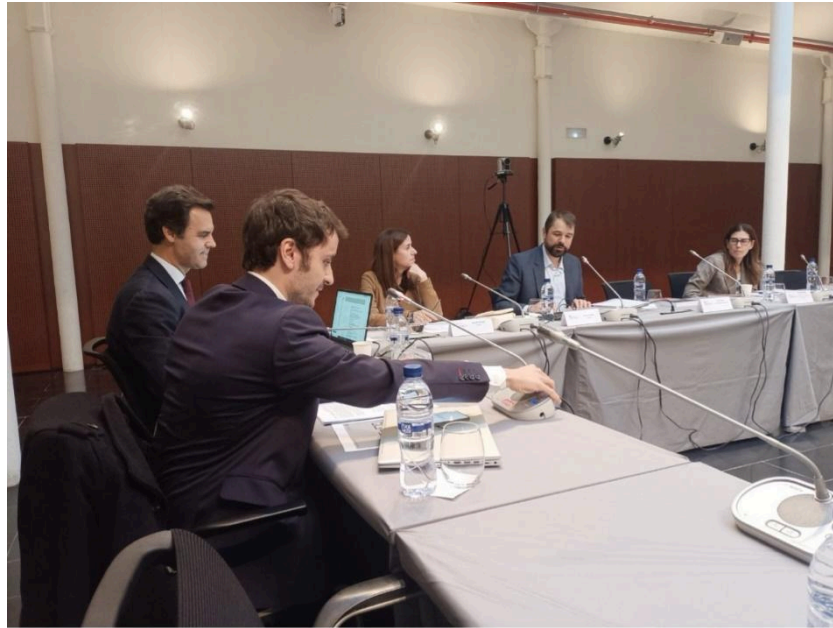
Imagen del Living Lab celebrado el 6 de noviembre de 2023 en la sede de la CMC en Barcelona

Debe advertirse que se emplean en este texto y en el ABGCR 2023 las expresiones originales en inglés “ nudging ” y “ nudge ”, así como su traducción al español recomendada por la Fundación del Español Urgente (FUNDÉU RAE, asesorada por la Real Academia Española y promovida por la Agencia EFE y el banco BBVA) es “ acicate ”, que se define como “incentivo” o “estímulo”, que puede ser una alternativa a “ nudge ” cuando se emplea como sustantivo (véase FUNDÉU RAE, Acicate , alternativa a nudge , (10 Oct. 2017) Buscador urgente de dudas , disponible en: https://www.fundeu.es/recomendacion/acicate-alternativa-a-nudge/ ).